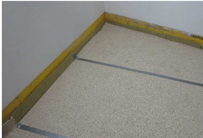
Abbildung A 2.1: Montagesituation mit Trittschalldämmmatten und Randdämmstreifen, Stöße mit Klebeband