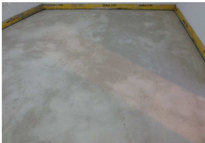
Abbildung A 2.3: Zementestrich (Prüfsituation)