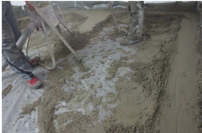
Abbildung A 2.2: Montagesituation mit Zementestrich